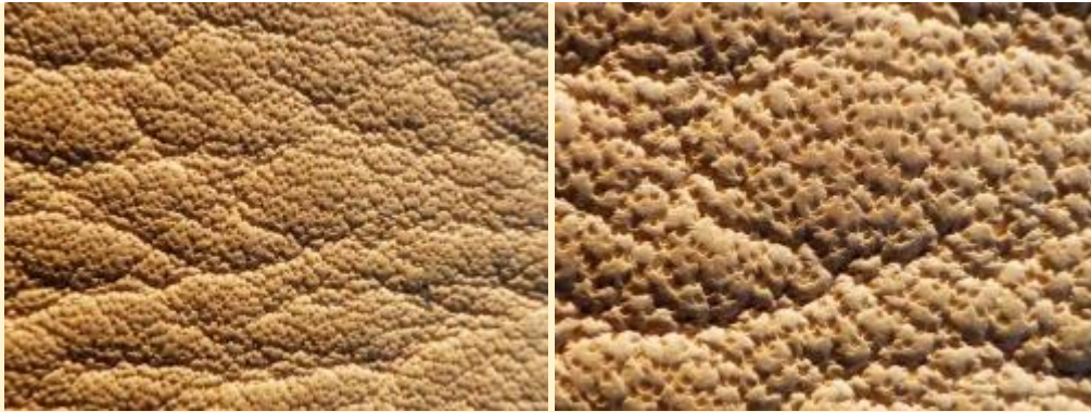
Puur anilineleer: de haar poriën zijn duidelijk zichtbaar, er is geen kleur coating op het leer aangebracht