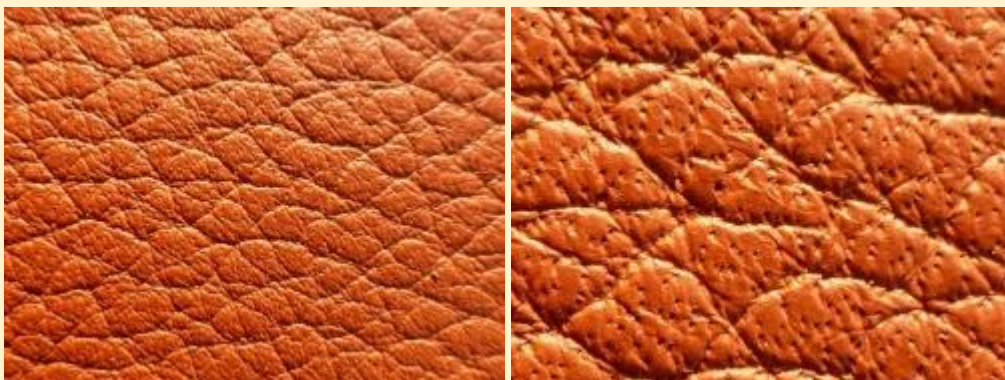
Semi-anilineleer: haar poriën zijn duidelijk zichtbaar, maar er is een dun laagje verf op het leer aangebracht